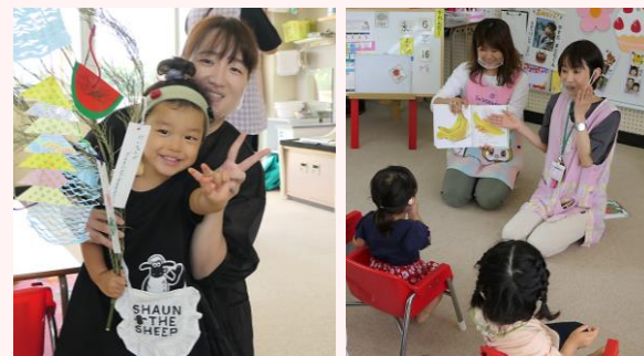
季節を味わう活動