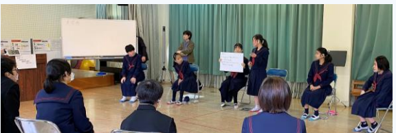
ライフスキル教育(ディベート)