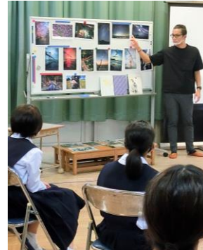
卒業生による先輩講演会