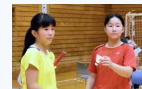
部活動(バドミントン部)