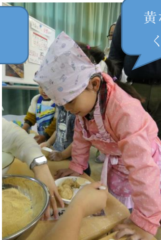
黄な粉餅を ください