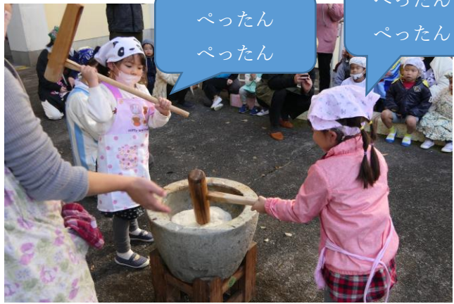
ぺったん ぺったん

幼稚部で餅つきを行いました。 保護者の方々にも協力していただき、みんなで、ぺったんぺったんつくことができました。