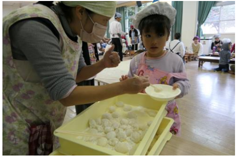
お代わりを ください